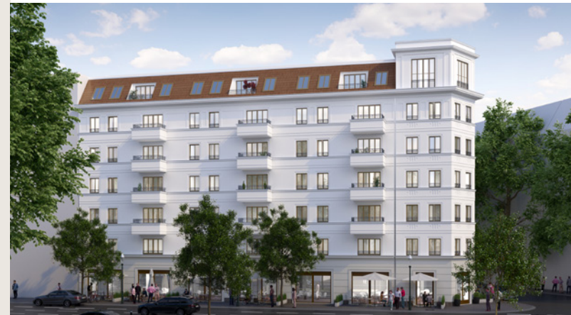
BERLIN - NEUKÖLLN