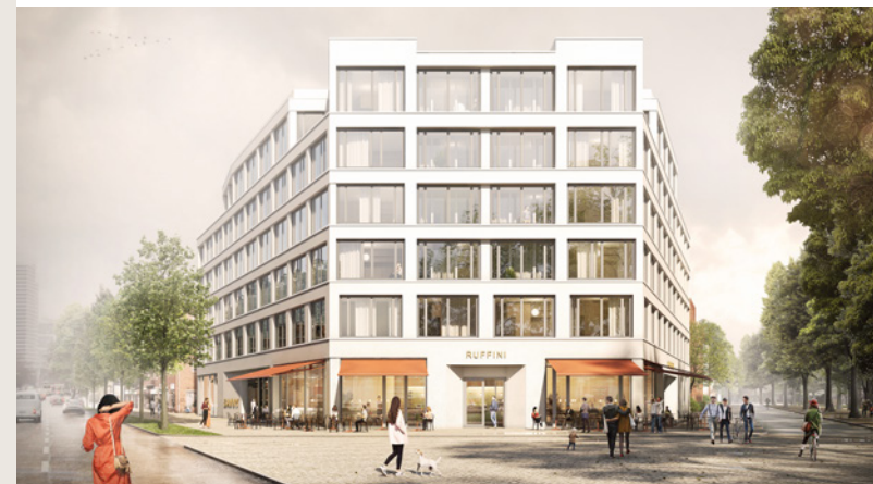
HAMBURG - UHLENHORST