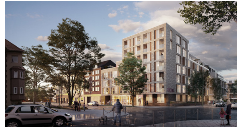
DÜSSELDORF - DERENDORF