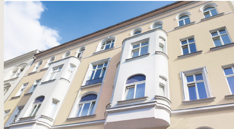
EIGENTÜMER- GEFÜHRTE HOTELS