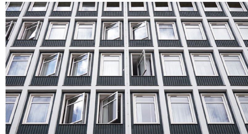
HOSTELS UND SERVICED APARTMENTS